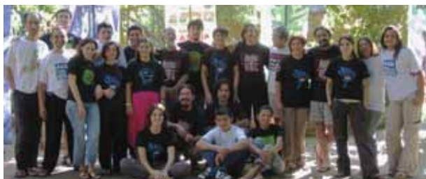
■ Medzinárodné stretnutie kampanierov Priateľov Zeme o finančných inštitúciách v uruguajskom Montevideu, marec 2007

Slovenská ekonomika a vládna hospodárska politika je pod silným vplyvom medzinárodných finančných inštitúcií. Jej veľkým problémom (a súčasne aj problémom globalizovanej ekonomiky) je jednostranná orientácia na ekonomický rast vyjadrený hrubým domácim produktom (HDP). V roku 2007 sme sa preto okrem sledovania činnosti medzinárodných verejných finančných inštitúcií venovali aj otváraniu diskusie o alternatívnych indikátoroch udržateľného rozvoja.