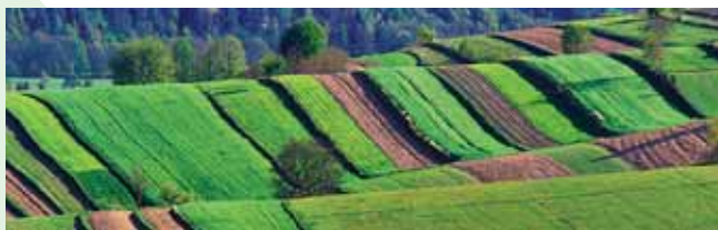
■ Hriňovské políčka v Mikroregióne Podpoľanie

Cieľovým regiónom, na ktorý sa sústreďujú aktivity tohto projektu, je oblasť Poľany. Tvorí ho územie štyroch mikroregiónov (Podpoľanie, Severné Podpoľanie, Rentár a Čierny Hron) zasahujúcich do Chránenej krajinej oblasti (CHKO) Poľana.