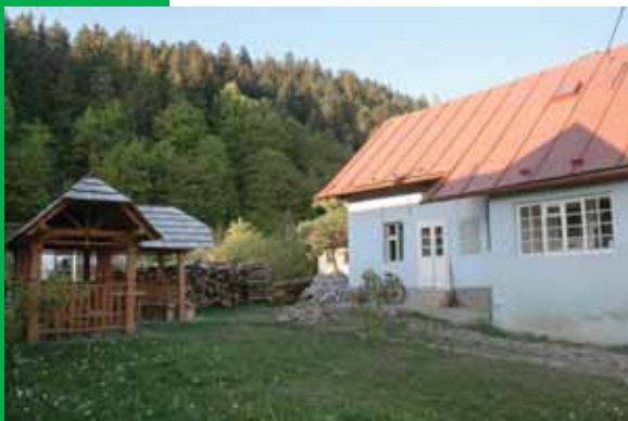
Sídlo Priateľov Zeme-CEPA na Ponickéj Hute

Smerom k spoločenskej spravodlivosti Verejný záujem verzus verejné financie