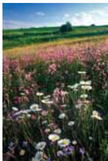
■ Lúka pri Čačíne, Mikroregión Severné Podpoľanie

Pre Mikroregión Podpoľanie sme rozpracovali návrh efektívneho systému koordinácie pomoci zo štrukturálnych fondov. Na príprave pilotného servisného centra pre tento mikroregión s nami spolupracovalo Európske centrum Západného Walesu, ktorý je súčasťou samosprávy v kraji Carmarthenshire vo Walese. Zámer získal podporu všetkých 16 obcí a 2 miest mikroregiónu aj Úradu Banskobystrického samosprávneho kraja. Pre predstaviteľov samospráv a MVO