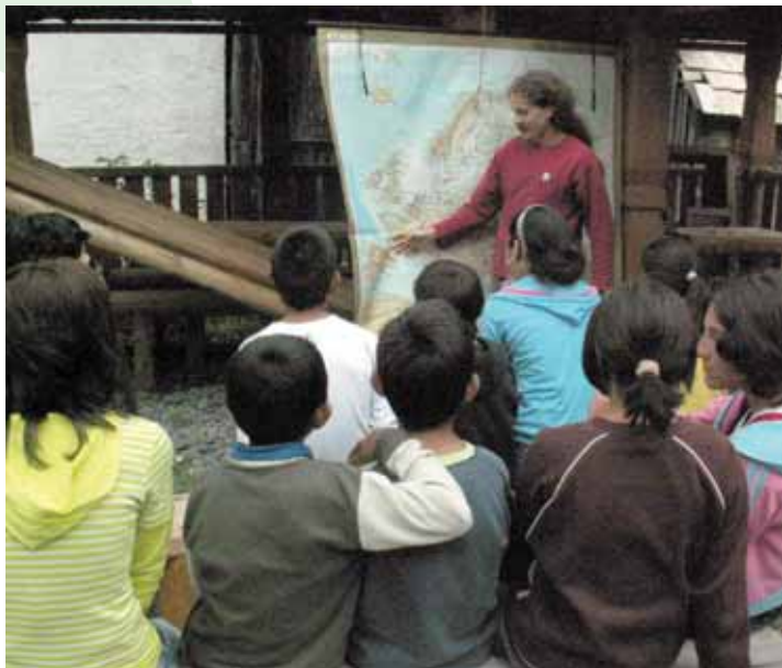
■ O migrácii Rómov v altánku na Ponickej Hute, október 2007

V spolupráci s Ústavom romologických štúdií Univerzity Konštantína Filozofa v Nitre sme organizovali stáže pre 34 študentov, ktorí sa zapojili do výskumných prác v regióne Poľana aj našich praktických aktivít v osade Lešť. Viacerí z nich prejavili záujem aj o ďalšiu spoluprácu na tomto projekte.