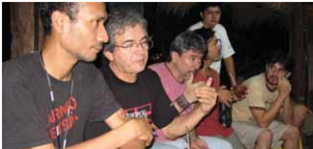
■ Zo st že n šho koordin tora v Par guaji o soci lnych vplyvoch medzin rodn ch investici , apr l 2007

Podarilo sa n m zos ladit  z mery našej organiz cie s cieľmi a aktivitami medzin rodnej siete CEE Bankwatch Network, ktor  prijala n š z mer venovať sa kritike politiky zameranej na ekonomick  rast a altern tvam k HDP. Vytvorili sme tak predpoklad k širšej medzin rodnej spolupraci, ktor  nadviaže na našu  vodn  št diu na t tu t mu (pozri Projekt Kvalita života).