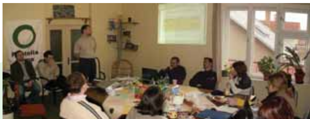
■ Výročné stretnutie v Banskej Bystrici, január 2008