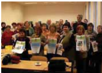
■ Predstavitelky ZŠ a SŠ s certifikátmi o vstupe do Klimatickej Aliancie

V rámci trilaterálneho rakúsko-česko-slovenského projektu „Dajme šancu Slnku“ pripravujeme rozšírenie medzinárodnej Klimatickej Aliancie o samosprávy a školy na Slovensku. Zorganizovali sme 30 seminárov o klimatických zmenách pre takmer 600 pedagógov, pracovníkov verejnej správy a osvetárov. Výsledkom je prijatie 27 škôl do Klimatickej Aliancie a záujem 5 samospráv o vstup do tohto medzinárodného združenia.