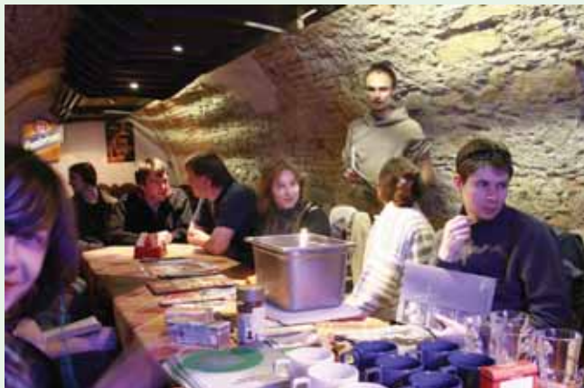
■ Večerná rozprava o spravodlivom obchode v Červenom Raku v Banskej Bystrici, marec 2007

V mediálnej práci sme udržali vysoký štandard z predchádzajúceho roku. Dobrá súčinnosť medzi projektovými koordinátormi a mediálnym koordinátorom bola základom dobrej mediálnej prezentácie organizácie v priebehu roka 2007.