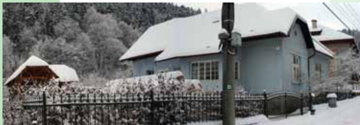
■ Sídlo Priatel'ov Zeme-CEPA na Ponickéj Hute

Priatel'ia Zeme-CEPA pôsobia na miestnej, regionálnej, národnej i medzinárodnej úrovni. Vyhľadávajú, podporujú a aktivizujú obĉanov a ich skupiny, rozvíjajú zručností a schopností svojich členov, pomáhajú vidieckym samosprávam pripravovať a realizovať projekty, ktoré podporujú trvalo udržateľný rozvoj a vyvíjajú osvetovú, publikačnú, konzultačnú, informačnú a vzdelávaciu činnosť.