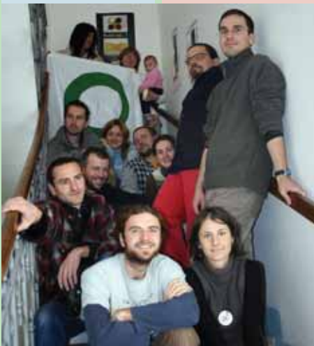
■ Tím Priateľov Zeme-CEPA