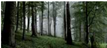
■ Lesy na Poľane

Pri presadzovaní podmienok pre udržateľný rozvoj sme sa v minulosti zameriavali najmä na medzinárodnú a národnú úroveň. Viedli sme