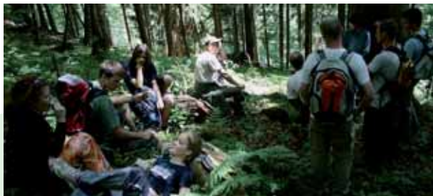
■ Oddych na výlete na Poľane, jún 2009