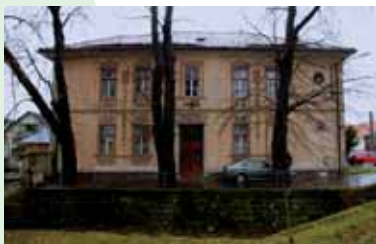
■ Sídlo Servisného centra pre mikroregión Podpoľanie v Detve

Podpoľanie pomohli získať podporu z Nórskeho finančného mechanizmu vo výške 565 tisíc EUR. Pomohli sme tak vytvoriť a zariadiť jedinečné Servisné centrum s 18 vyškolenými pracovníkmi, ktorých úlohou bude harmonizovať projektové zámery, pripravovať z nich zmysluplné projekty