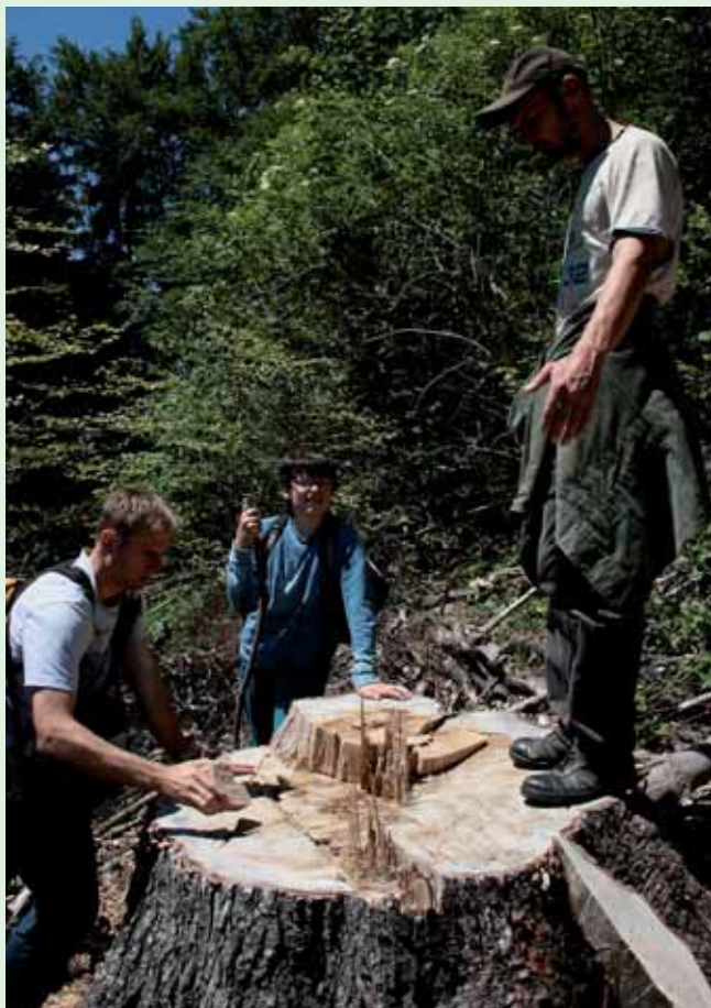
■ Na poznávacom výlete o lesoch na Poľane, jún 2009

V roku 2009 sme zaviedli prípravu tzv. fundraisingových konceptov pre každý projekt. Tieto dokumenty nám uľahčujú hľadať doplnkové zdroje na spolufinancovanie projektov a pripravovať nadväzujúce iniciatívy. Stále sa nám však nedarí kryť významnejšiu časť našich príjmov z iných ako grantových zdrojov. V roku 2009 sme preto rozpracovali niekoľko zámerov, ktoré by v budúcnosti mohli priniesť príjmy na krytie režijných nákladov organizácie.