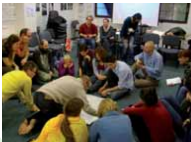
Na zhromaždení CEE Bankwatch Network, Nepřivěc, október 2009

Vyhodnotili sme príspevok čerpania fondov EÚ na Slovensku k znižovaniu vplyvov klimatickej zmeny. Naše podklady sa stali súčasťou publikácie CEE