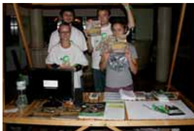
■ Premietanie filmov o investíciách EIB v rozvojových krajinách, Bratislava, september 2010

Zapojili sme sa do Counter Balance, čo je európska koalícia rozvojových a environmentálnych mimovládnych organizácií (MVO), ktoré konfrontujú politiku EIB v krajinách mimo EÚ. Snažíme sa zvýšiť informovanosť verejnosti a politikov