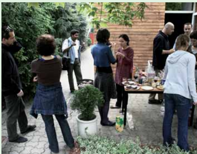
■ Stretnutie členov a priaznivcov Priateľov Zeme-CEPA v záhrade bratislavskej kancelárie, Bratislava, máj 2009

Zintenzívnili sme aj komunikáciu s členmi Správnej rady. Jej členovia sa zapájajú do dôležitých vnútorných diskusií (napr. pri zmenách programov, interpersonálnych problémoch či pri príprave organizačného manuálu Priateľov Zeme-CEPA, ktorý vyjasňuje pravidlá fungovania, rozdelenie kompetencií v rámci organizácie a mal by zjednodušiť komunikáciu medzi pracovníkmi).