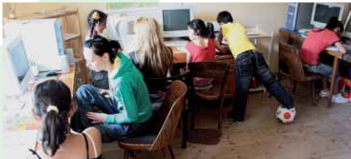
■ Deti z Lešte sa pod vedením stážistov učia pracovať na počítači, Ponická Huta, jún 2009

Nestabilný záujem detí však napriek veľkému vynaloženému úsiliu a kapacitám z našej strany značne ovplyvnil predpokladané výsledky programu. Preto sme sa rozhodli zúžiť cieľovú skupinu zmeniť celkový prístup. Pozornosť sme sústredili najmä na podporu niekoľkých aktívnych dievčat, ktoré preukázali chuť a potrebu odovzdávať nadobudnuté vedomosti a zručnosti ďalej a využívať ich v praxi. V októbri sme začali realizovať projekt Načo sedieť doma? zameraný na dobrovoľnícku činnosť a aktivity pripravované skupinou dievčat. V úvode projektu pripravovali dievčatá prezentácie a workshopy pre študentov UMB v Banskej Bystrici.