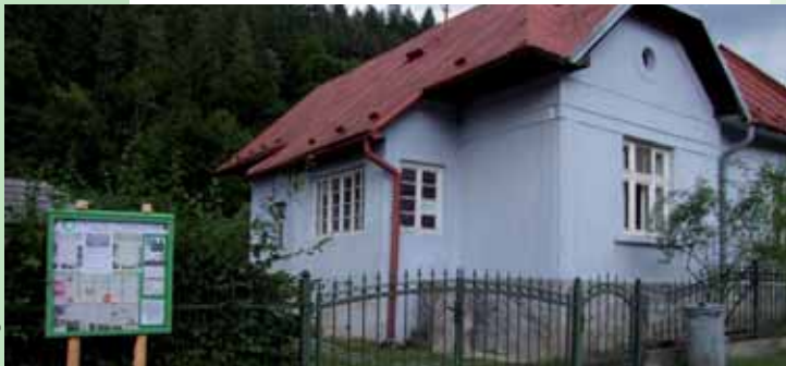
■ Sídlo Priateľov Zeme-CEPA na Ponickej Hute