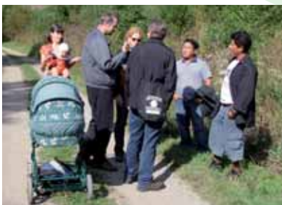
Hostia z FOIRN z regiónu Rio Negro a z rakúskej centrálnej Klimatickej Aliancie na prechádzke za Ponickou Hutou, október 2009

V rámci projektu Dajme šancu Slnku sa nám podarilo ďalej rozšíriť Klimatickú Alianciu na Slovensku – jej členmi sú už 4 samosprávy a 70 škôl. Pripravili sme viac osvetových podujatí pre samosprávy, školy i verejnosť, vrátane súťaže Klíma bez hraníc, panelovej diskusie „Klimatické zmeny – zodpovednosť bez hraníc“