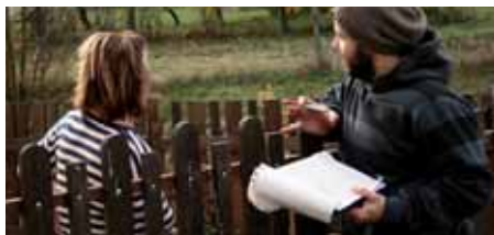
■ Zber údajov o nakladaní s bioodpadmi v domácnostiach, Horný Tisovník, november 2009

Pilotný projekt využívania lokálnych zdrojov odpadovej biomasy na vykurovanie 43 verejných objektov v 8 obciach okolo Banskej Bystrice, ktorý sme pripravovali od roku 2003, získal podporu z Európskeho fondu regionálneho rozvoja v sume vyše 6 mil. EUR. Súčasťou projektu je aj vytvorenie regionálneho systému prípravy drevnej štiepky z dreveného odpadu z miestnych píl.