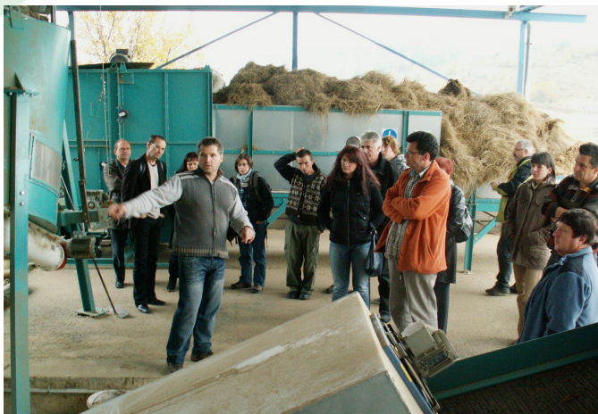
■ Prehliadka výroby peliet zo sena na Ponikách

Začali sme hodnotiť energetickú efektívnosť verejných budov v štyroch mikroregiónoch okolo Poľany. Cieľom bolo preukázať potrebu zatepľovania a navrhnúť opatrenia na odstránenie zbytočných tepelných strát. Pre samosprávy sme pripravovali 2 druhy materiálov: energetické certifikáty a správy z termovíznej diagnostiky objektov. Naši spolupracovníci zozbierali podkladové údaje pre 34 verejných budov. Deväť z nich sme odovzdali odborníkom s oprávnením vypracúvať energetické certifikáty. Termovíznú diagnostiku vykonával náš expert. Tento druh služieb sme obciam poskytovali bezplatne, ale za záväzok, že v budúcnosti budú v hodnotených objektoch realizovať úsporné opatrenia. Je to praktická a v regióne Poľana jediná služba tohto druhu.