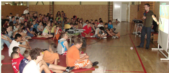
■ Prednáška o klíme na ZŠ v Lučenci

Hinzenbach. Tábor mal výbornú odozvu, pretože zážitkovou formou priblížil deťom zložité témy a poskytol im aj príležitosť asistovať pri inštalácii solárneho zariadenia na streche reštaurácie.