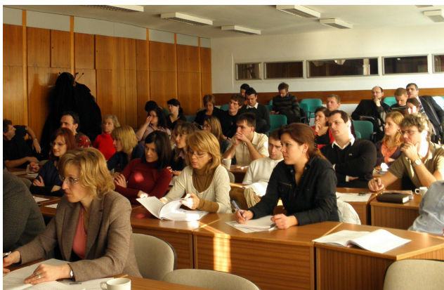
■ Konferencia o protikorupčných opatreniach pri riadení fondov EÚ v Bratislave

rast spaľovania dreva a vyvolali tlak na zvyšovanie už aj tak jeho neúnosnej ťažby a odčerpávanie jeho zásob z vidieka.