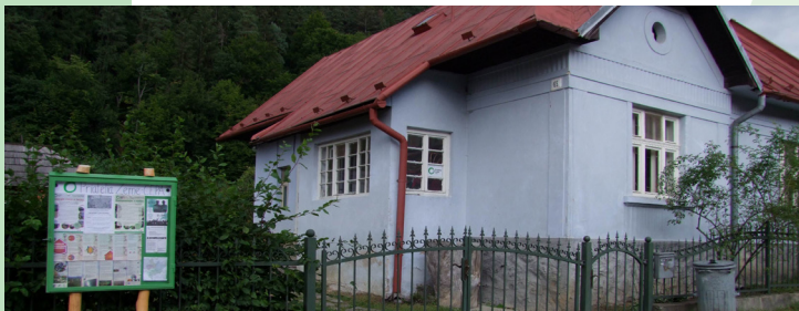
■ Sídlo Priateľov Zeme-CEPA na Ponickkej Hute