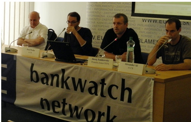
Konferencia Klíma, rozvoj a energetika v Bratislave

a surovinovú politiku. V rámci európskej koalície Counter Balance sme viedli kampaň za zmenu pravidiel poskytovania pôžičiek EIB v krajinách Juhu tak, aby investície EIB nepodkopávali ich rozvojové, environmentálne a sociálne záujmy a ľudské práva miestnych komunití. Koalícii sa podarilo presadiť dôležité zmeny v externom mandáte EIB, ktoré posilnia kontrolu EÚ nad jej investíciami. Na rôznych fórach sme sa snažili priblížiť verejnosti, akademikom, médiám a študentom kontroverzné pôsobenie EIB vo svete.