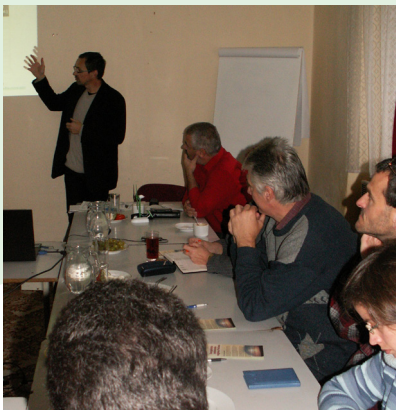
Kurz o udržateľnej energetike na Ponickéj Hute

z každej témy a získalo certifikáty. Na jeseň sme kurz obsahovo aj technicky vylepšili a pripravili sme ďalšie dva turnusy. Absolvovalo ich 31 účastníkov, z nich 26 získalo certifikát. Viacerí absolventi prejavili záujem o ďalšiu spoluprácu a niektorí sa už aj zapojili do konkrétnych projektov. V tomto roku sme tak vyškolili na Poľane spolu 47 osôb. Z nich chceme postupne formovať regionálnu skupinu na podporu udržateľnej energetiky.