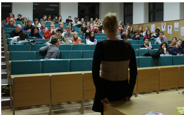
Premietanie o pôsobení EIB mimo EÚ v Bratislave

Pre nedostatok kapacít sme sa prestali venovať nevýhodnému a predraženému financovaniu verejných investícií formou tzv. verejno-súkromných partnerstiev (PPP). Obmedzili sme sa na sledovanie plánovanej výstavby diaľnice D1 v úseku Turany – Hubová. Európska komisia aj vďaka našej iniciatíve nesúhlasila s výstavbou úseku povrchovým variantom, ktorý by poškodil lokality zaradené do siete Natura 2000 a Ministerstvo dopravy SR upustilo od zámeru financovať tento projekt prostredníctvom PPP a výstavbu odsunulo.