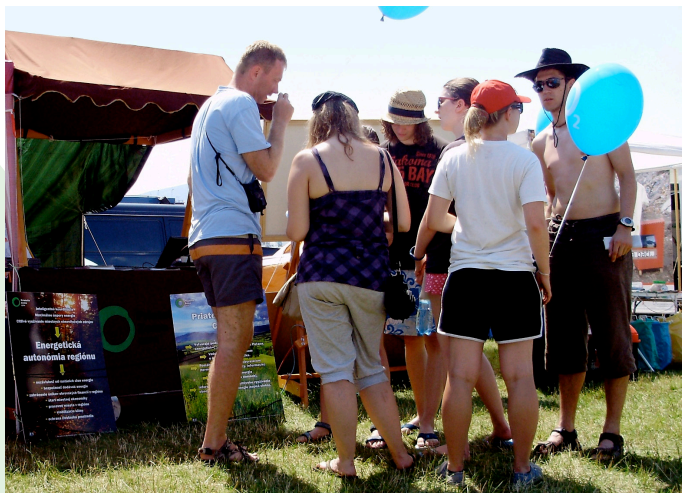
Pred infostánkom na Pohode

Našu osvetovú prácu dotvárali prednášky pre školy o zmene klímy. Vďaka podpore britskej ambasády sme v obciach okolo Poľany uskutočnili letné informačné turné v obciach pod Poľanou zamerané na propagáciu úspor a využívania solárnej energie v rodinných domoch. Využili sme na ňom infostánok s demonštračnou fotovoltaickou zostavou a množstvom informačných materiálov pre verejnosť. S infostánkom sme sa zúčastnili aj rôznych festivalov a spoločenských podujatí (napr. v júni na Ekofeste v Trnave a na folklórnom festivale Deti pod Poľanou v Hriňovej, v júli na festivale Pohoda 2011 v Trenčíne). V júli sme vyslali 23 detí z rôznych kútov Slovenska na „slniečny tábor“ Klimatickej aliancie v rakúskej obci