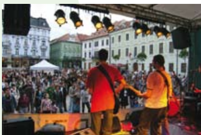
■ Benefičný koncert pre Kremnicu v Bratislave, máj 2006