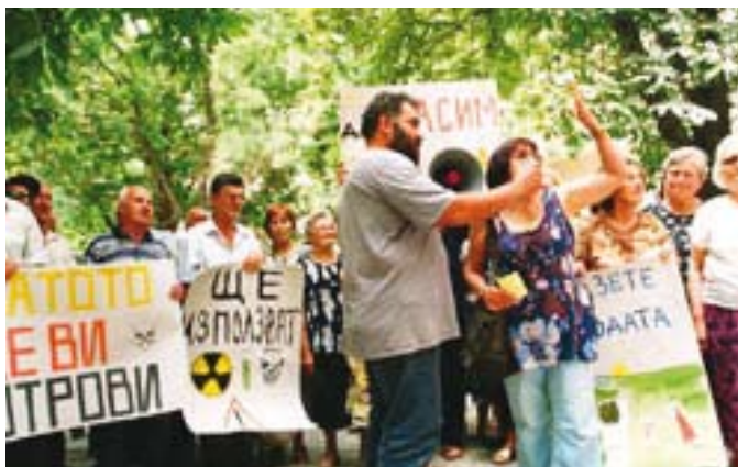
■ Protest proti plánovanej pôžičke EBRD na ťažbu zlata kyanidovou metódou v bulharskom Krumovgrade, február 2006

Spolupracovali sme aj na medzinárodných projektoch zameraných najmä na zvýšenie transparentnosti verejných finančných inštitúcií. Napríklad, prípadovou štúdiou zo Slovenska sme prispeli do publikácie Behind Closed Doors: Secrecy in International Financial Institutions (Za zatvorenými dverami: utajovanie informácií v medzinárodných finančných inštitúciách) , ktorú vydala sieť Global Transparency Initiative.