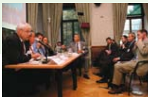
■ Komisar EÚ Vladimír Špidla na seminári o spoločenskej zodpovednosti firiem v Prahe, september 2006

Druhou oblasťou bolo porovnávanie výšky, rozsahu a intenzity verejných stimulov pre veľkých zahraničných investorov oproti podpore domácich malých a stredných podnikateľov. Keďže vláda odmietla zverejniť požadované informácie, museli sme ich vymáhať v niekoľkých právnych sporoch. Podporu nám v tomto poskytli organizácie Občan a demokracia a Via Iuris, avšak napriek úsiliu sa nám nepodarilo získať dostatok informácií pre dokončenie porovnávacej štúdie.