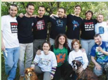
■ Tím Priateľov Zeme-CEPA