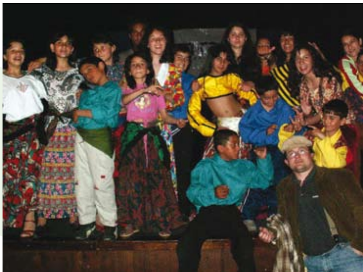
■ Deti z osady Lešť po vystúpení počas Týždňa rómskej kultúry v Nitre, apríl 2006

Sme presvedčení o tom, že bez zásadného zlepšenia kvality života najviac znevýhodnenej skupiny v regióne Poľana – Rómov – nie je možné hovoriť o jeho udržateľnom rozvoji. Preto sme v roku 2006 pokračovali v aktivitách na podporu obyvateľov segregovanej rómskej osady Lešť pri obci Poniky. Projekty zamerané na rozvoj životných zručností mládeže a žien sme postupne rozširovali o náročnejšie iniciatívy, najmä rozvoj muzikality talentovaných rómskych detí. Rozhodli sme sa sústrediť naše kapacity na hľadanie a rozvíjanie vrodeneho hudobného talentu u detí z osady Lešť, ktorý je inak potláčaný ich rodinným zázemím, chudobou a tlakom okolitého prostredia. V roku 2006 sa nám podarilo vytvoriť bezpečné a kvalitné materiálne podmienky pre osobnostný rozvoj týchto detí. Rómske deti sa zúčastňovali mnohých tvorivých dielní, výuky a nácvikov, výletov a exkurzií. Ich výsledkom bol nielen značný pokrok v hre na hudobné nástroje a speve, ale aj vlastný repertoár prezentovaný na viacerých festivaloch a kultúrnych podujatiach na Slovensku a kultivácia ich vystupovania na verejnosti.