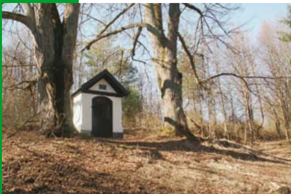
Ponická Huta ■

Smerom k udržateľnému rozvoju Verejný záujem verzus verejné financie Občan verzus korporácie