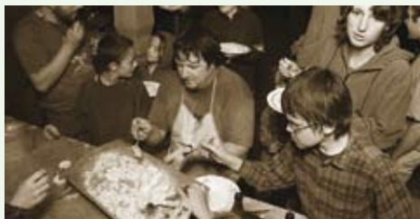
■ Papanica 2006 – stretnutie na Ponickéj Hute na podporu azylantov, september 2006

Dôležitou prioritou našej organizácie z pohľadu inštitucionálneho rozvoja je posilňovanie nášho pôsobenia na regionálnej a lokálnej úrovni. Oproti