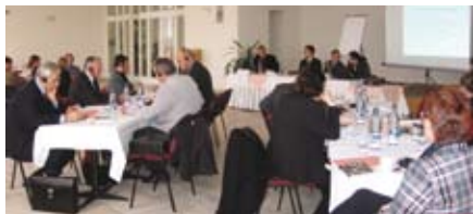
■ Konferencia o verejnej kontrole vodárenských služieb v Bratislave, november 2006

Naše aktivity dlhodobo zameriavame na oblasť vodárenských služieb s cieľom podporovať ich verejnú správu a dôslednú kontrolu. Zorganizovali sme medzinárodnú konferenciu Verejná kontrola vodárenských služieb a alternatívy k ich privatizácii . Akcia potvrdila, že privatizácia nerieši problémy, ktorým čelia vodárenské spoločnosti na Slovensku a že tieto problémy sa dajú úspešne riešiť v rámci verejne spravovaných vodárenských služieb. Konferencie sa zúčastnili najmä manažéri vodárenských spoločností, ktorí prijali našu ponuku k ďalšej spolupráci. Výstupom bol zborník prednášok a stanovenie princípov dobrej správy vodárenských spoločností. Poskytli sme ich inštitúciám, ktoré rozho-