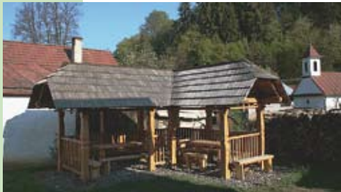
■ Altánok v areáli Priateľov Zeme-CEPA na Ponickej Hute

Priatel'ia Zeme-CEPA pôsobia na miestnej, regionálnej, národnej i medzinárodnej úrovni. Vyhľadávajú, podporujú a aktivizujú občanov a ich skupiny, rozvíjajú zruč-