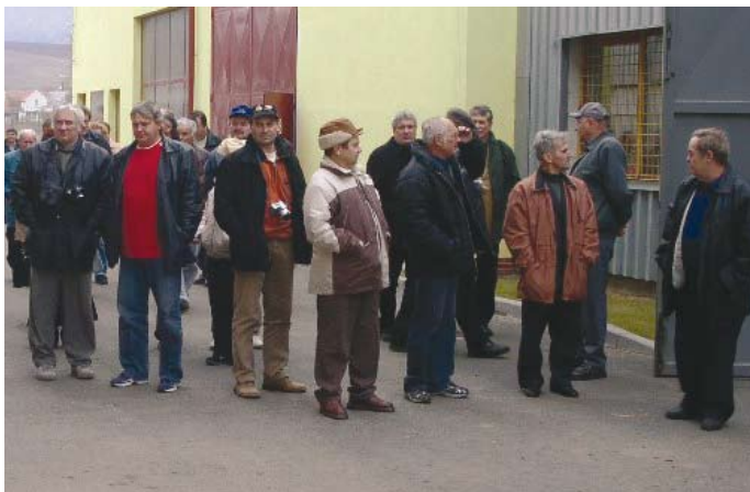
■ Zástupcovia obcí z regiónu Poľana na exkurzii na Morave, november 2006

Ako reakciu na množiace sa projekty a plány neudržateľnej komercionalizácie drevnej suroviny na energetické účely sme pripravili návrh zásad účelného a efektívneho využívania biomasy na Slovensku. Tento pracovný materiál podrobíme na budúci rok odbornej kritike a po zapracovaní pripomienok budeme presadzovať, aby sa navrhované zásady premietli do metodických pokynov, ktoré upravujú štátnu dotačnú aj nefinančnú podporu projektov využívania biomasy.