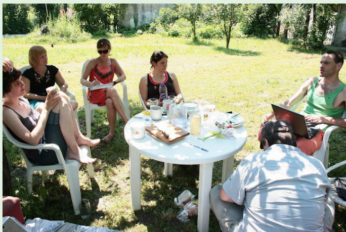
■ Polročná plánovacia porada tímu

Našu činnosť sme financovali aj v roku 2010 najmä z grantov, ktorých spolufinancovanie odčerpalo časť finančnej rezervy organizácie. Pripravili sme však niekoľko zámerov, ktoré by mohli v budúcnosti finančne stabilizovať našu organizáciu a zabezpe-