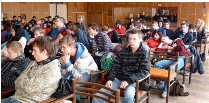
Premietanie filmu Vek hlupákov v Košiciach

V spolupráci s Britskou radou sme dokončili a spustili nový energetický portál pre samosprávy zameraný na poskytovanie zrozumiteľných informácií o udržateľnej energetike, energetickom plánovaní, úsporách a citlivom využívaní obnoviteľných zdrojov.