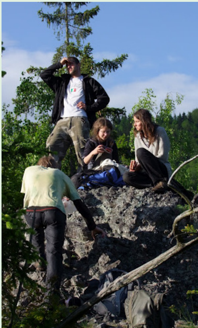
■ Májová víkendovka na Poľane

čiť príjmy na spolufinancovanie nových projektov. Niektoré sme v roku 2010 začali testovať – týkajú sa najmä poskytovania služieb a poradenstva v oblasti energetiky a poznávacích výletov na Poľane.