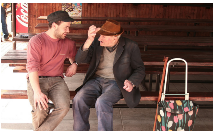
■ Zber údajov na Polane

s cieľom minimalizovať nezákonné a nesprávne spôsoby nakladania s BRKO. Pracovné verzie koncepcií sme prekonzultovali so samosprávami a ich pripomienky sme zapracovali. V decembri sme v obci Medzibrod odovzdali finálne koncepcie samosprávam.