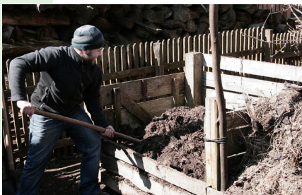
■ Kompostovisko v záhrade Priateľov Zeme-CEPA na Ponickej Hute

Spolu s Priateľmi Zeme-SPZ sme pripravili a vydali informačný balíček s atraktívnymi letákmi a s pomocou 100 vyškolených miestnych aktivistov a študentov sme ho distribuovali do niekoľko tisíc domácností, škôl, obchodov, obecných úradov, zdravotníckych zariadení vo všetkých štyroch mikroregiónoch. O aktivitách sme informovali regionálne aj národné médiá, poskytli sme im desiatky rozhovorov a podkladov pre reportáže. Vytvorili sme osobitnú webstránku o kompostovaní, poskytovali sme konzultácie občanom a samosprávam, robili sme prednášky pre pedagógov a študentov škôl v regióne a vytvorili sme zelenú linku na poskytovanie konzultácií, šírenie informácií a vyhľadávanie dobrovoľníkov.