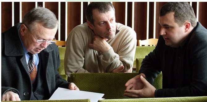
Odovzdávanie štúdie uskutočniteľnosti starostvi obce Očová

vydali metodicko-edukačný balíček o klíme a udržateľnej energetike. Jeho súčasťou bol aj didaktický materiál „Nepohodlná pravda v triede“ zameraný na integráciu témy klimatickej zmeny do vyučovania. O praktickom využití balíčka sme vyškolili 15 pedagógov. Na základných školách v Čiernom Balogu, v Brusne a v Banskej Bystrici sme inštalovali výstavu združenia Živica „Klíma nás spája“. Vyškolili sme 12 mladých lektorov, ktorí potom na výstave sprevádzali skupiny žiakov a k výstave sme vytlačili aj metodické príručky pre učiteľov a pracovné listy pre žiakov. Navštívilo ju 1 200 žiakov.