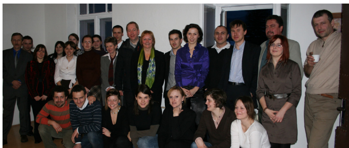
Nórska veľvyslankyňa a britský veľvyslanec s personálom SC a Priateľov Zeme-CEPA na slávnostnom otvorení SC v Detve

a podporovať počas činnosti, začalo v roku 2010 poskytovať služby 18 vidieckym samosprávam pri využívaní verejných fondov. Cieľom úvodnej fázy jeho činnosti bolo otestovať potreby samospráv, ich schopnosť zvládnuť koordináciu takéhoto systému a navrhnuť jeho zlepšenia do budúcnosti. Činnosť SC riadilo Koordináčne združenie obcí mikroregiónu Podpoľanie (KZ). Nezávislý Regionálny poradný panel, ktorého činnosť viedol náš zástupca, sledoval plnenie plánovaných výstupov a poskytoval KZ a personálu SC odporúčania na zlepšenie činnosti. SC zamestnávalo 17 osôb, z toho 3 hlavných a 8 lokálnych projektových manažérov. V roku 2010 SC pripravilo spolu 69 menších a 53 väčších projektov (z nich 26 bolo úspešných a získalo podporu vyše 646 tisíc EUR), vypracovalo alebo aktualizovalo 17 strategických dokumentov, pomáhalo realizovať 26 projektov a vytvorilo databázu aktuálnych grantových a dotačných programov, ktorá bola obsahom a rozsahom ojedinelá na Slovensku. Všetky obce boli priebežne informované o nových grantových výzvach. Odhadovaná hodnota činnosti SC pre samosprávy bola takmer 90 tisíc EUR.