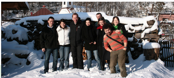
■ Britský veľvyslanec u Priateľov Zeme-CEPA na Ponickéj Hute