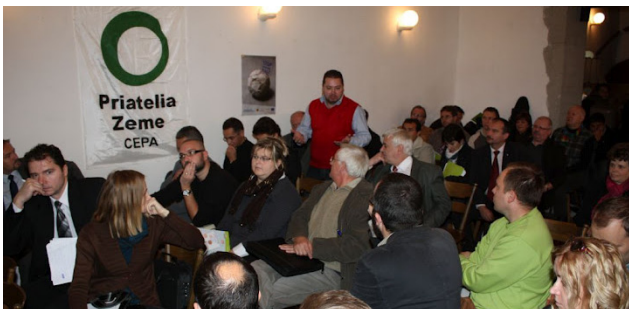
Seminár o sociálnej inklúzii rómskych komunít v Spišskej Kapitule

Venovali sme sa aj hodnoteniu zneužívania fondov EÚ na údajnú podporu marginalizovaných rómskych komunít. Zisťovali sme, ktoré projekty boli v rámci tejto tzv. horizontálnej priority podporené. V októbri sme spolu s Fondom sociálneho rozvoja a združením Človek v tísi Slovensko pripravili seminár o efektívnosti využívania nástrojov na začleňovanie marginalizovaných rómskych komunít do spoločnosti. Seminár bol dobrou príležitosťou k dialógu medzi viac ako 70 účastníkmi o rôznych opatreniach financovaných najmä z fondov EÚ, ktoré mali pomáhať zlepšovať situáciu v rómskych komunitách a o prekážkach v ich kvalitnom využívaní.